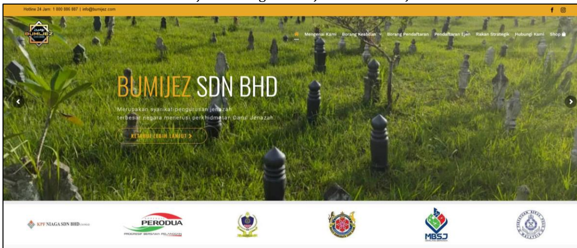
Gambar Rajah 2: Pengurusan Jenazah Darul Jenazah