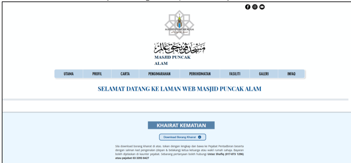
Gambar Rajah 4: Pengurusan Jenazah Masjid Puncak Alam